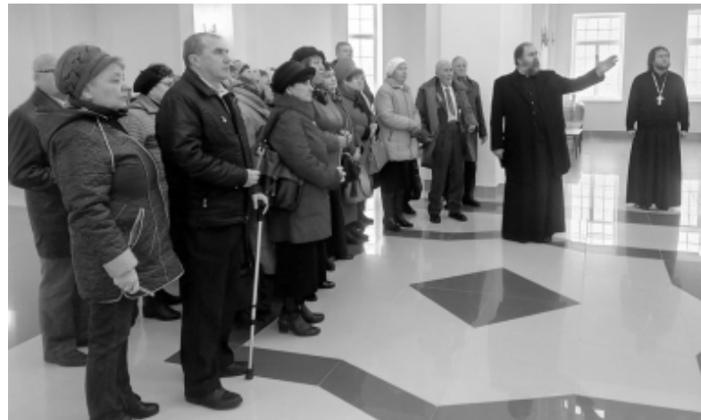
Бывшие малолетние узники, ветераны труда и вдовы совершили экскурсию в новый храм Георгия Победоносца